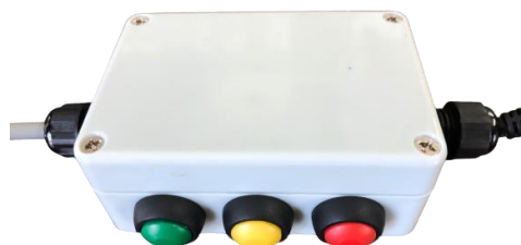
本体風量調整コントローラー