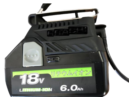
外部バッテリー使用可